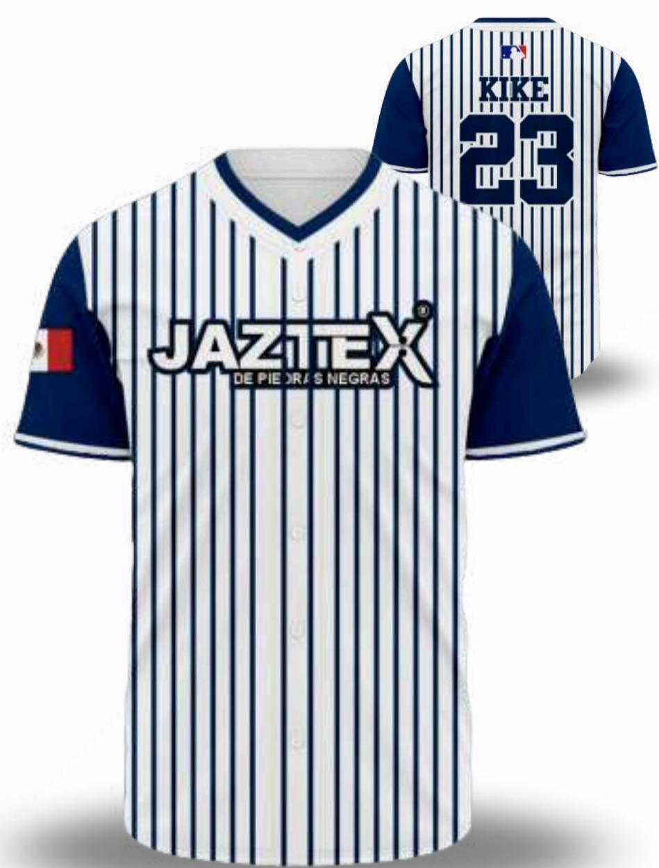
JERSEY IMITACIÓN / TALLAS DISPONIBLES DE BÉISBOL