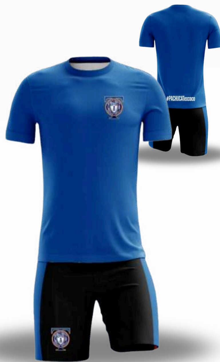
UNIFORME PARA INSTITUCIONES / TALLAS DISPONIBLES DE GOBIERNO O PRIVADAS SHORT Y JERSEY XS-S-M-L-XL-2XL-3XL-4XL-5XL