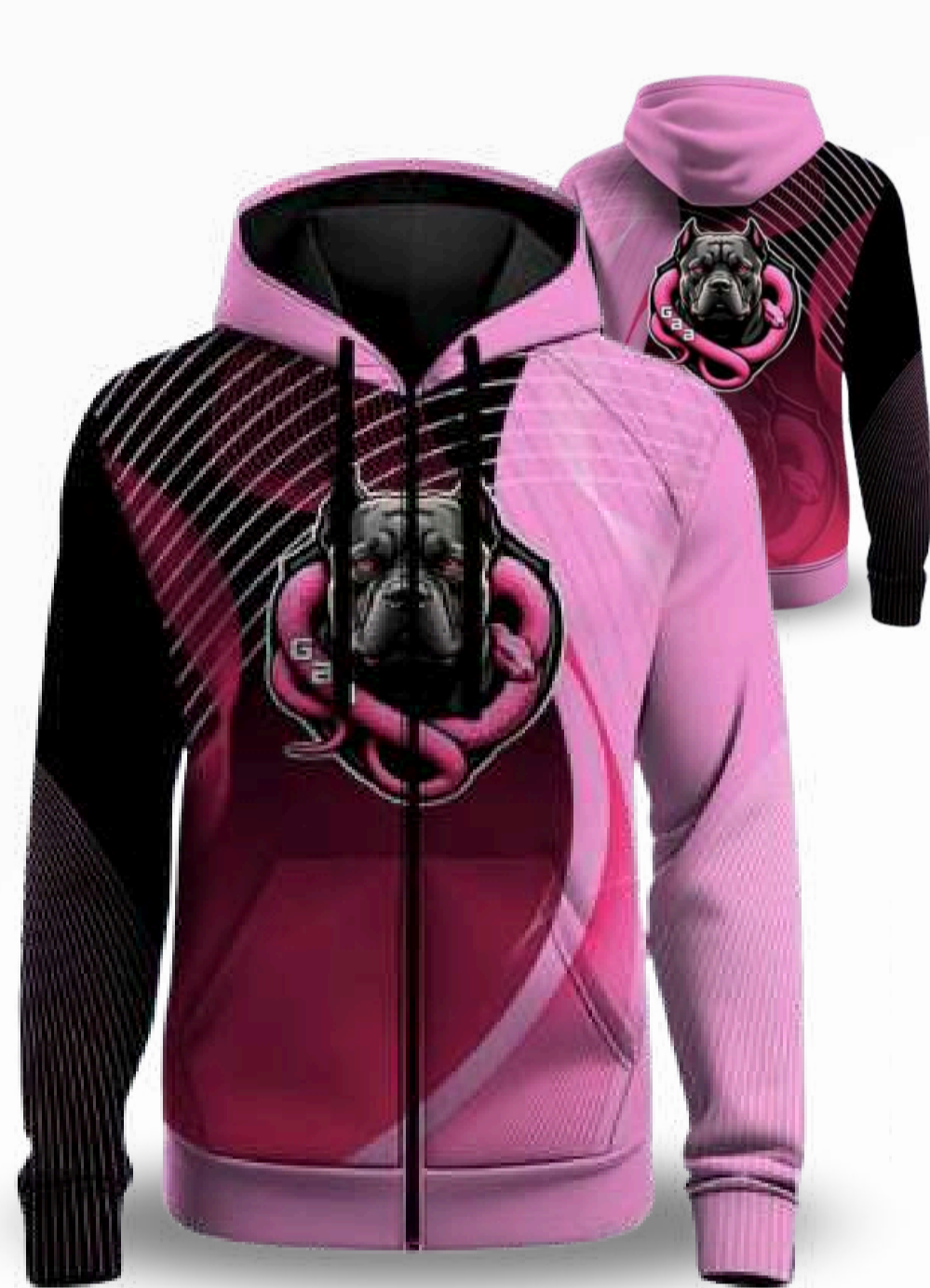
HOODIE CON ZÍPER / TALLAS DISPONIBLES XS-S-M-L-XL-2XL-3XL-4XL-5XL