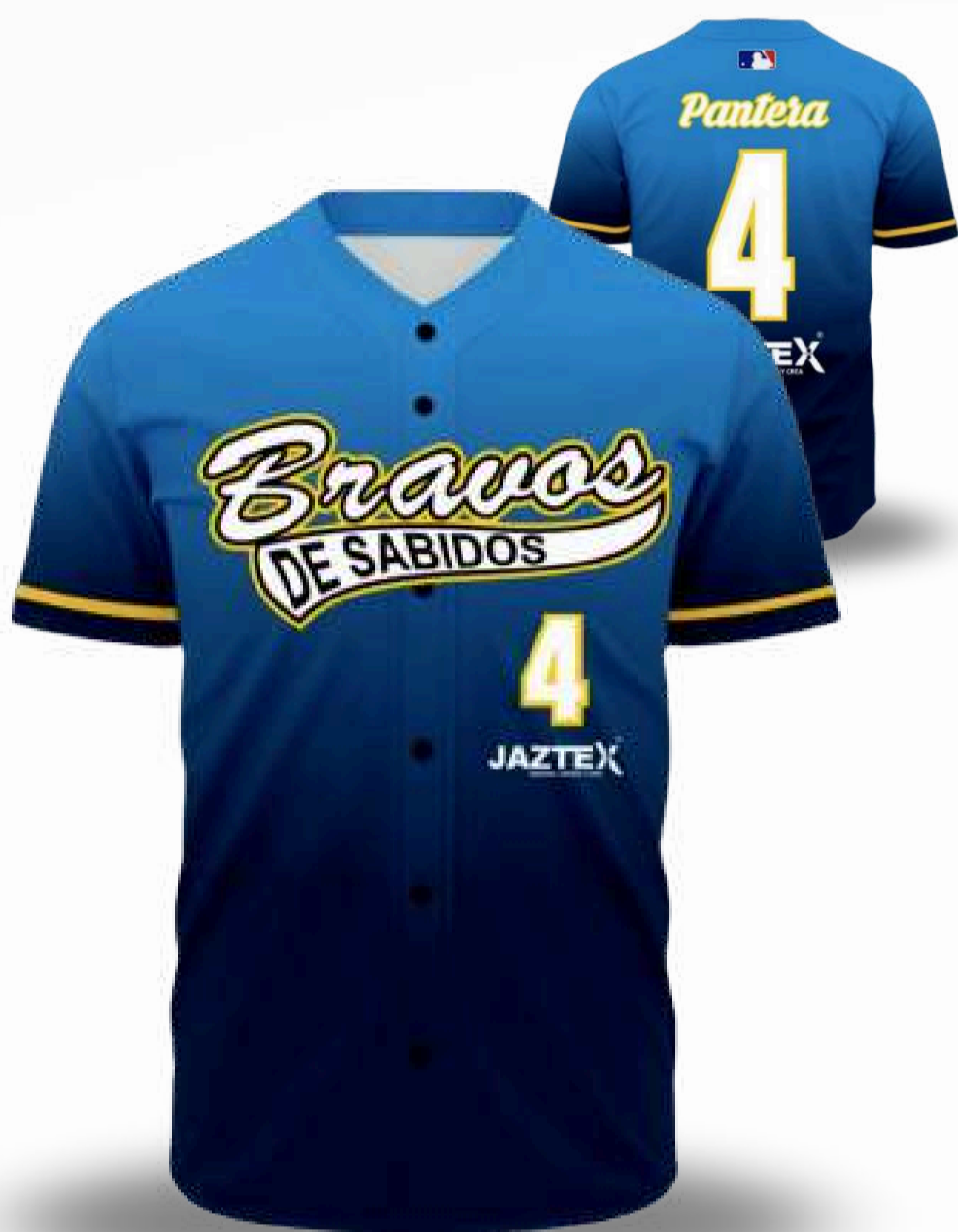
JERSEY BEISBOLERA / TALLAS DISPONIBLES CUELLO V