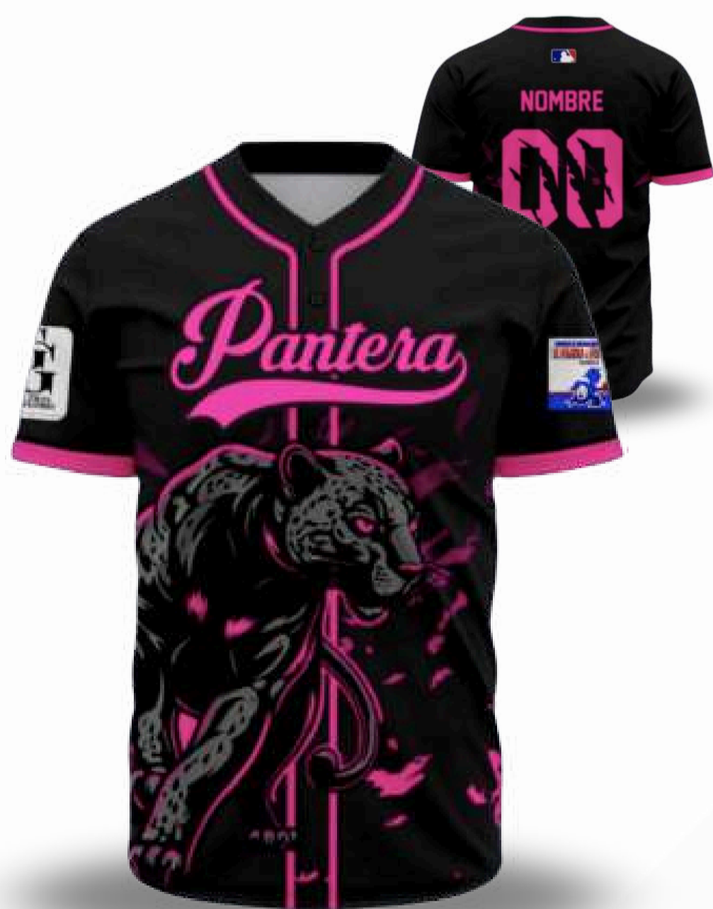
JERSEY BEISBOLERA / TALLAS DISPONIBLES DE 2 BOTONES