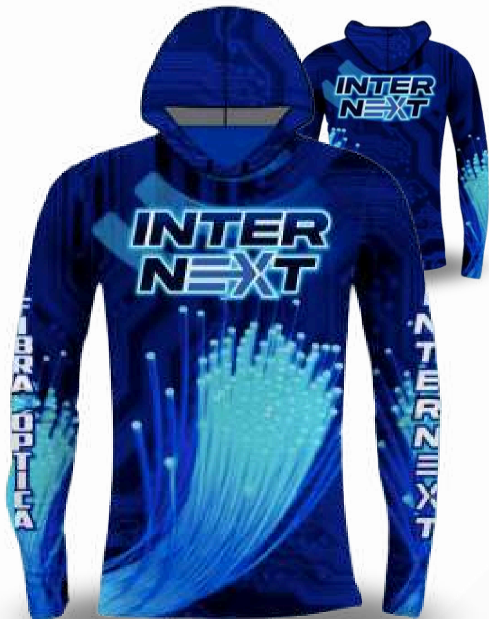
JERSEY MANGA LARGA / TALLAS DISPONIBLES CON GORRO XS-S-M-L-XL-2XL-3XL-4XL-5XL