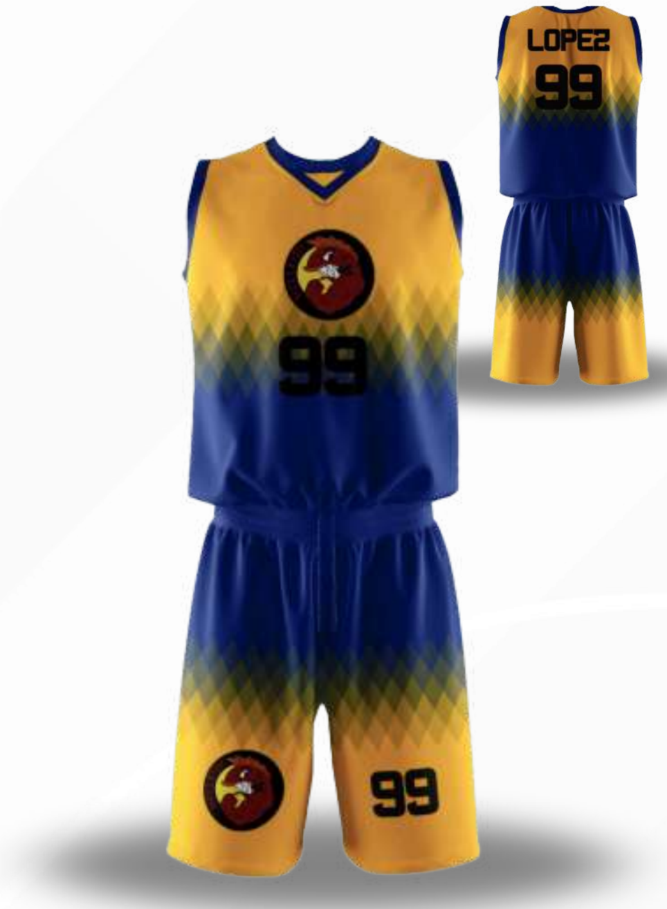
UNIFORME DE BALONCESTO / TALLAS DISPONIBLES INCLUYE SHORT Y JERSEY XS-S-M-L-XL-2XL-3XL-4XL-5XL