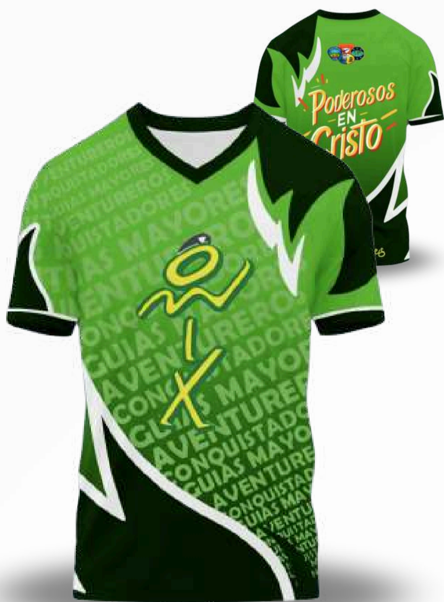
JERSEY MANGA CORTA / TALLAS DISPONIBLES XS-S-M-L-XL-2XL-3XL-4XL-5XL