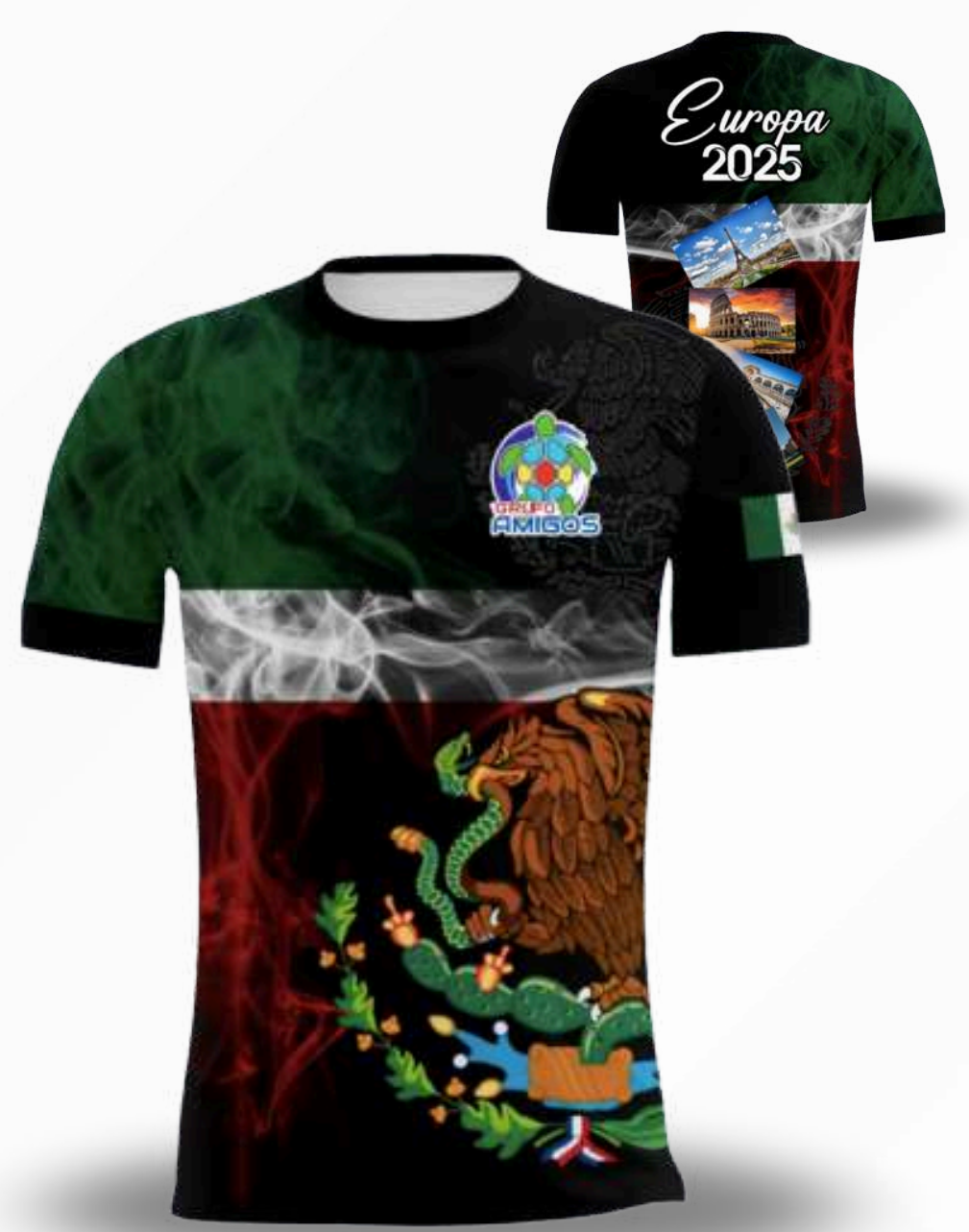
UNIFORME DE TOCHO / TALLAS DISPONIBLES INCLUYE SHORT Y JERSEY XS-S-M-L-XL-2XL-3XL-4XL-5XL