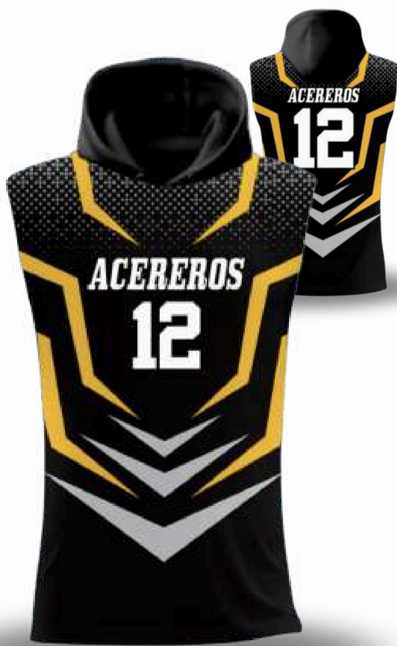
UNIFORME DE ATLETISMO / TALLAS DISPONIBLES INCLUYE SHORT Y JERSEY XS-S-M-L-XL-2XL-3XL-4XL-5XL