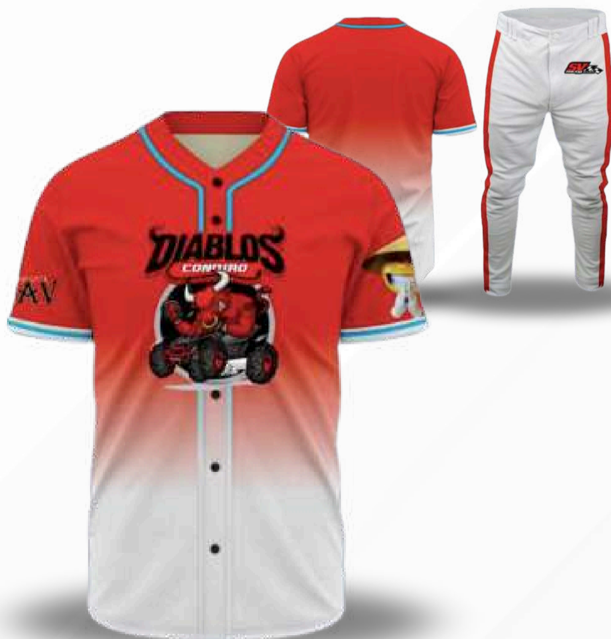
UNIFORME DE BÉISBOL / TALLAS DISPONIBLES INCLUYE PANTALÓN Y CAMISOLA