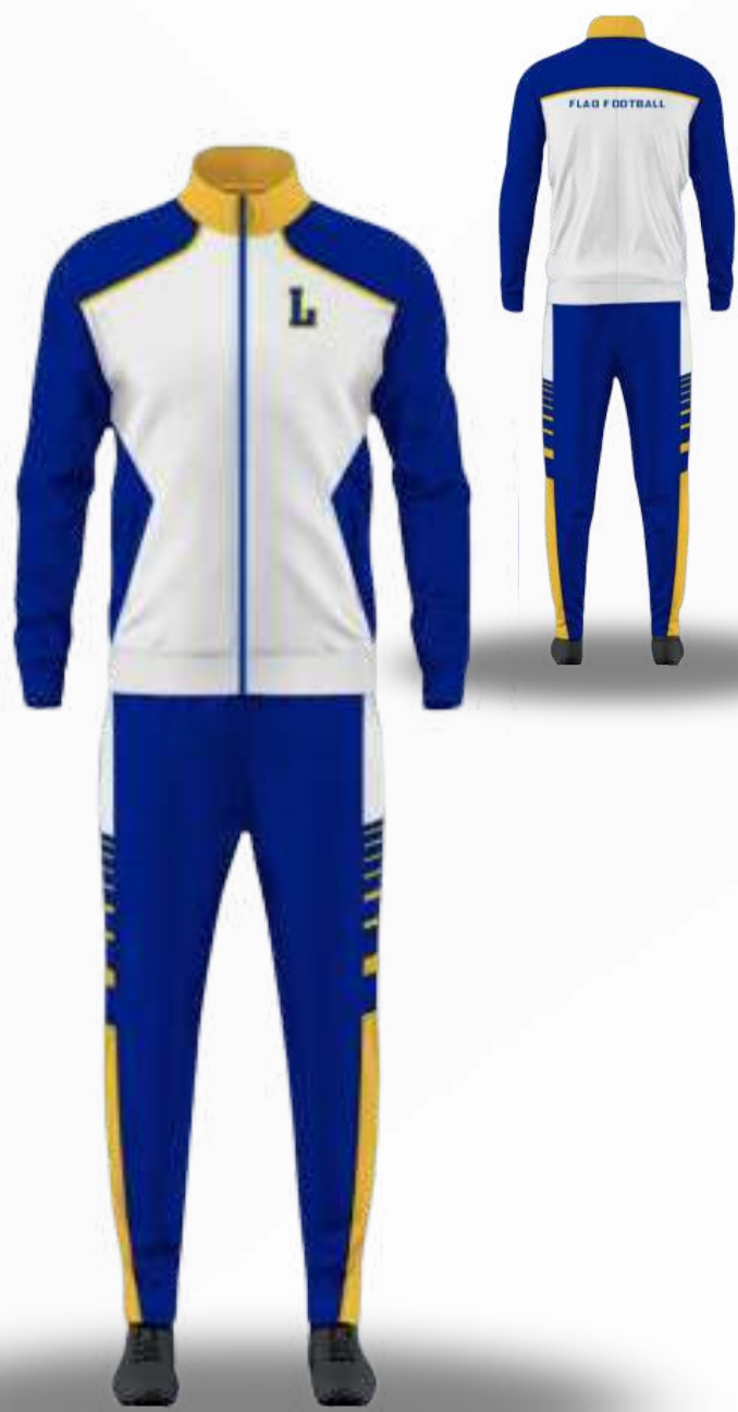
CHAMARRA (O JERSEY) Y PANTS / TALLAS DISPONIBLES XS-S-M-L-XL-2XL-3XL-4XL-5XL