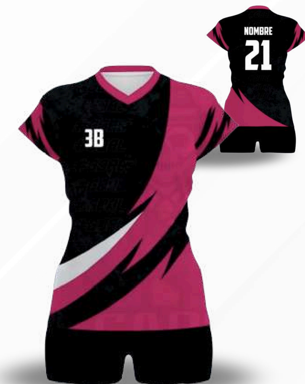
UNIFORME DE VOLIBOL / TALLAS DISPONIBLES INCLUYE SHORT Y JERSEY XS-S-M-L-XL-2XL-3XL-4XL-5XL