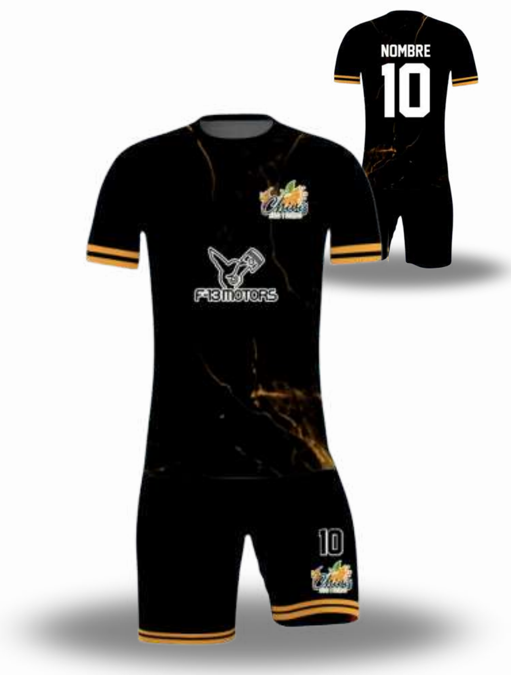
UNIFORME DE FUTBOL / TALLAS DISPONIBLES INCLUYE SHORT Y JERSEY XS-S-M-L-XL-2XL-3XL-4XL-5XL