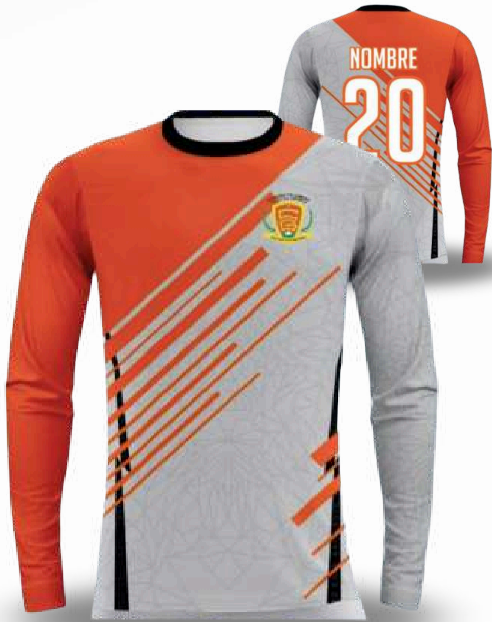
JERSEY MANGA LARGA / TALLAS DISPONIBLES XS-S-M-L-XL-2XL-3XL-4XL-5XL