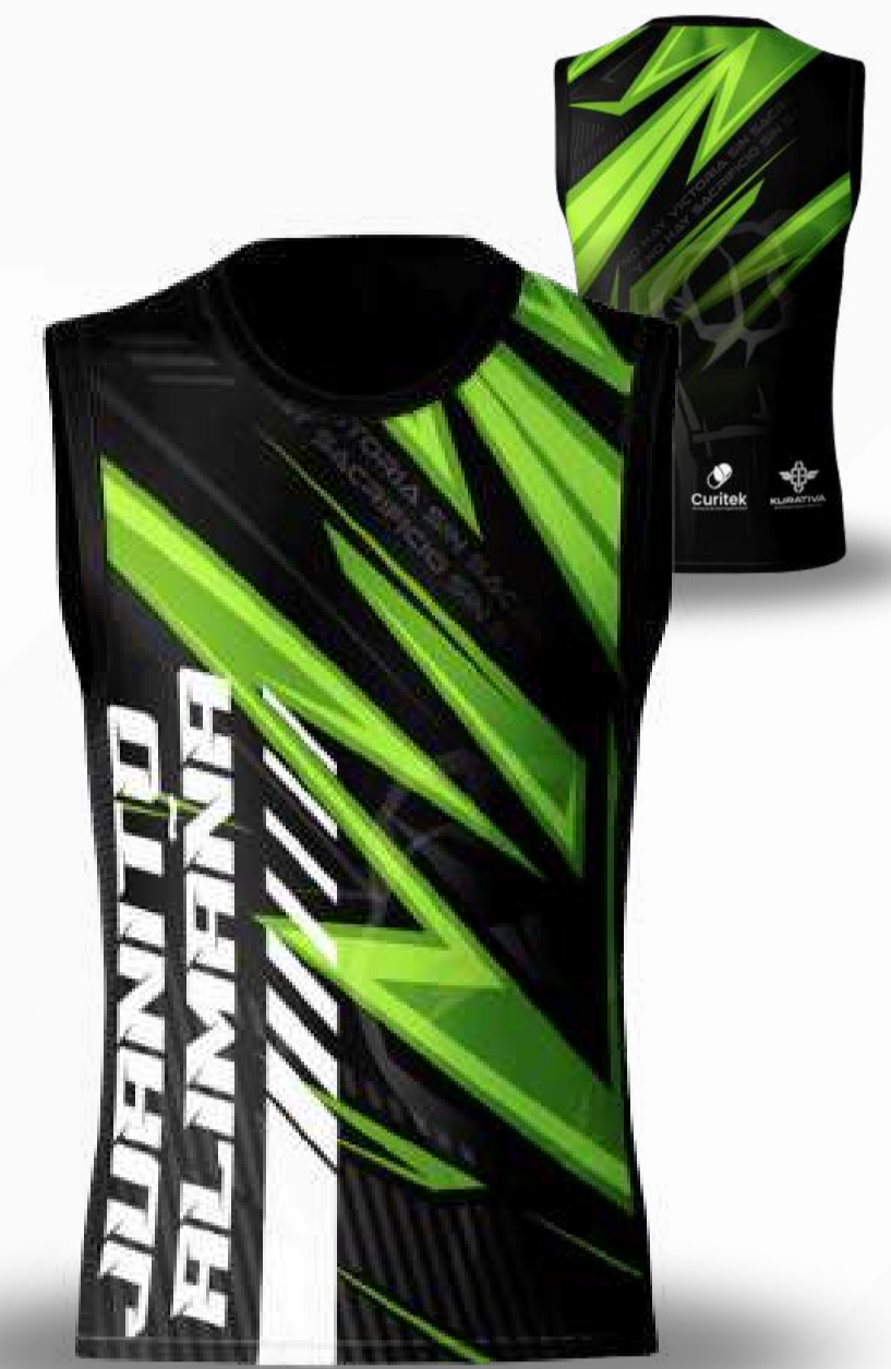
UNIFORME DE PÁDEL / TALLAS DISPONIBLES INCLUYE SHORT Y JERSEY XS-S-M-L-XL-2XL-3XL-4XL-5XL