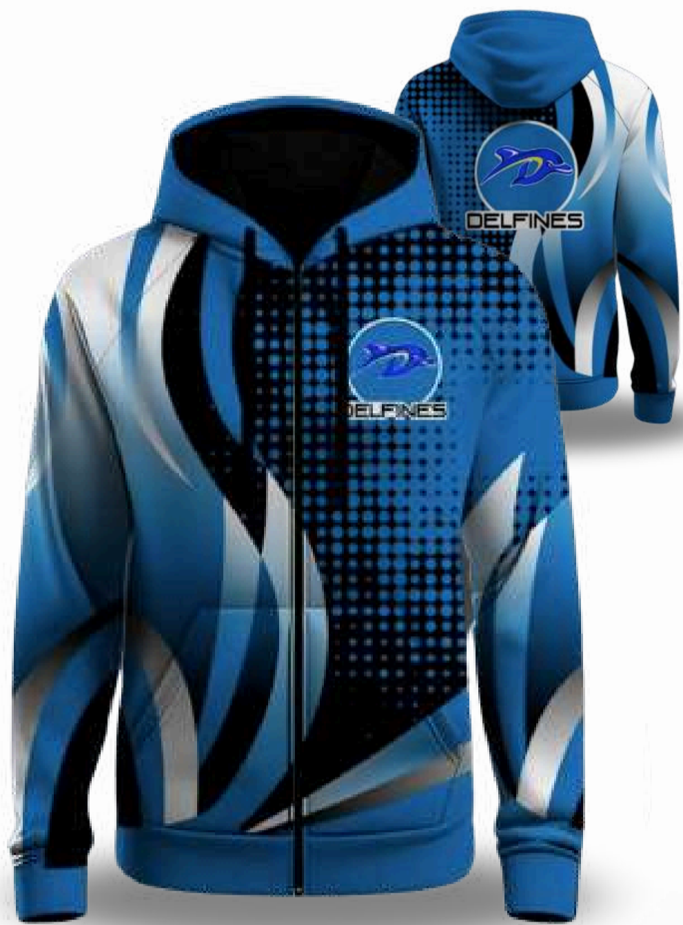
HOODIE CON GORRO / TALLAS DISPONIBLES XS-S-M-L-XL-2XL-3XL-4XL-5XL